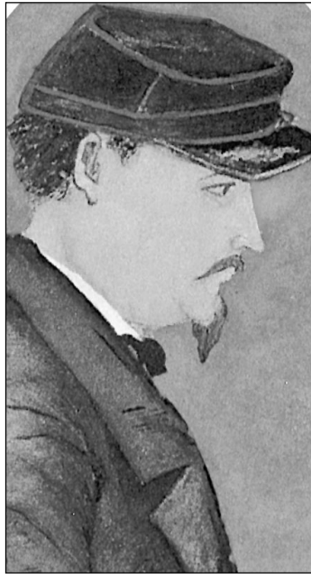
Arxiu Carles Querol

Per dimensionar la magnitud del declivi cal, en primer lloc, conèixer quins eren els actius de can Guineu a l'època de Pere Mir i Porta. Pel que fa a finques agrícoles, tenien en propietat les del Mas Corbatera, les Planes de Vilarnau, can Canals, Mas Marquettes, l'Ai-